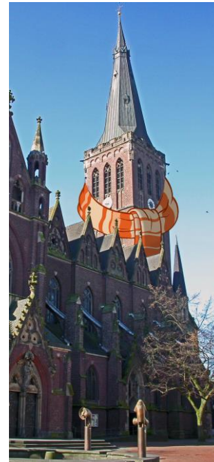
Fotomontage Dieter Mai

Die Einzelteile werden von den Mitarbeiterinnen des ALO's zu einem großen Schal zusammengenäht.